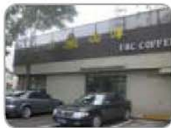
⑤ 上岛咖啡 汇园公寓 64994842