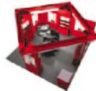
标准展位变形-5 (最小 36 平方米) 额外费用: ¥830/平方米