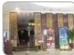
⑦ 馒头皇港式茶餐厅 汇园公寓N座1层大堂 84988863