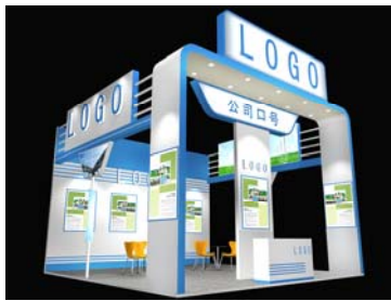
特装展台搭建-1 36 平方米三面开口 参考价格: ¥750/平方米