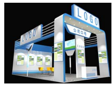
特装展台搭建-3 54 平方米三面开口 参考价格: ¥700/平方米