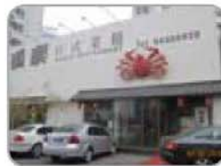
⑥ 道乐日式菜馆 汇园公寓N座P座首层 84980820