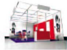
标准展位变形-6 (最小 24 平方米) 额外费用: ¥830/平方米