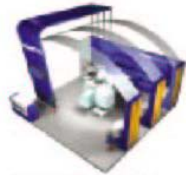
标准展位变形-4 (最小 24 平方米) 额外费用: ¥660/平方