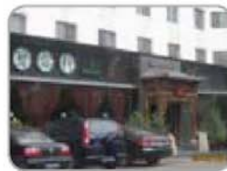
③ 碧露轩茶艺 汇园公寓R座一层 84977951