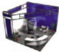
标准展位变形-3 (最小 24 平方米) 额外费用: ¥580/平方米