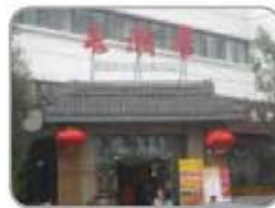
② 长湘居 汇园酒店公寓Q座南 64976877