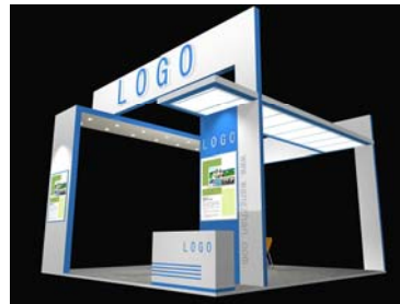
特装展台搭建-2 36 平方米四面开口 参考价格: ¥650/平方米