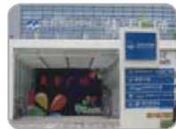
★ 北辰时代美食广场 北辰时代生活广场B1层 - 味干拉面 - 澳门品味茶餐 84989620 - 拿渡麻辣香锅 58207651 - 王品台塑牛排 84985734/84985743